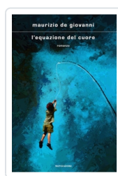
L'equazione del cuore De Giovanni, Maurizio