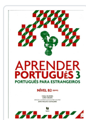
Aprender Português 3 (Manual+audio online) Oliveira, Carla