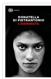
L'Arminuta Di Pietrantonio, Donatella