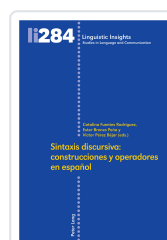
Sintaxis Discursiva: Construcciones Y Operadores En Español : 284 AA.VV.