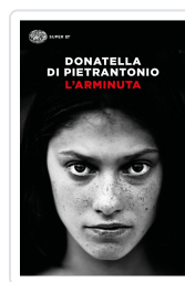
L'Arminuta Di Pietrantonio, Donatella