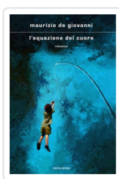
L'equazione del cuore De Giovanni, Maurizio