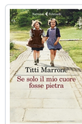
Se solo il mio cuore fosse pietra Marrone Titti