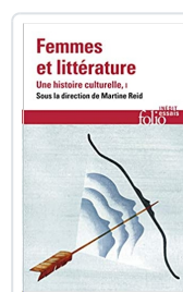
Femmes et littérature Vol. 1 Collectif