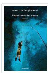
L'equazione del cuore De Giovanni, Maurizio