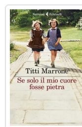
Se solo il mio cuore fosse pietra Marrone Titti