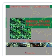
Energia solare e architettura Piemontese, Antonietta; Scarano, Rolando