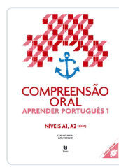
Aprender Português 1 (Comp Oral+audio online) A1-A2 Oliveira, Carlos de