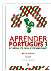
Aprender Português 3 (Manual+audio online) Oliveira, Carla