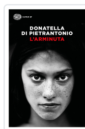
L'Arminuta Di Pietrantonio, Donatella