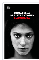
L'Arminuta Di Pietrantonio, Donatella