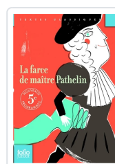
La farce de maître Pathelin Anónimo