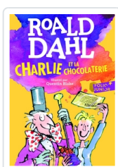
Charlie et la chocolaterie Dahl, Roald