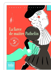
La farce de maître Pathelin Anónimo