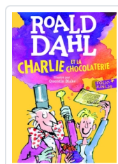
Charlie et la chocolaterie Dahl, Roald