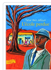
L'école perdue Jelloun, Tahar Ben