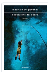
L'equazione del cuore De Giovanni, Maurizio