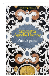
Punto pieno Agnello Hornby, Simonetta