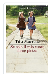
Se solo il mio cuore fosse pietra Marrone Titti