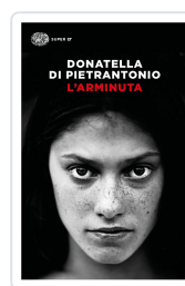
L'Arminuta Di Pietrantonio, Donatella